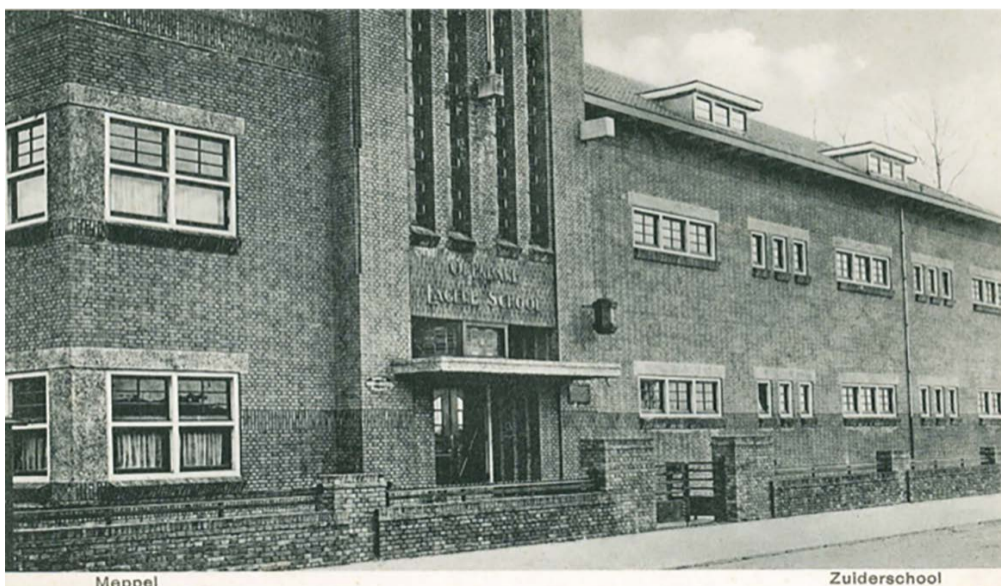
De Zuiderschool in 1929 vlak na de oplevering. Het aanzien is amper gewijzigd.