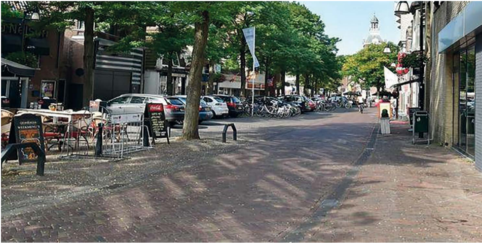
Huidige situatie Prinsengracht 2020